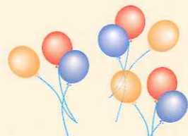
◀当日は大いに賑わいました