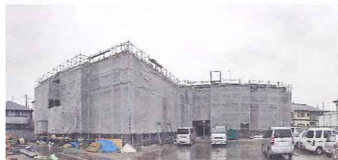
(平成26年12月12日現在進捗状況)