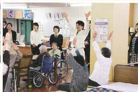
一緒に体操される一幕も