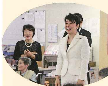
笑顔いっぱいに来苑された有村前大臣