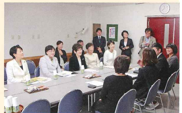
見学後は男性の育児休業取得への取り組み等活発な意見交換が行われました