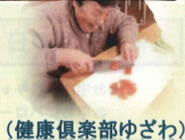
(健康倶楽部ゆざわ)