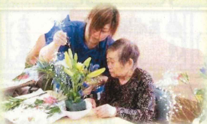
健康倶楽部つどい