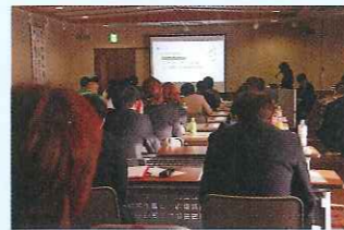
地域事例発表会の様子

各施設が日頃より取り組んでいるケアを皆様に伝える法人事例研究発表会を行いました。今年、21事例の発表があり、全国大会へ6事例選出されました。毎年研究としての精度が高くなっています。地域事例発表会も多くの方に来て頂きました。今後は、各施設での苗場カフェでの開催を予定しております。是非おいで下さい。