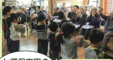
上郷保育園の 子供たちに XOXO。