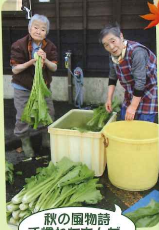
秋の風物詩 手慣れたもんだ。