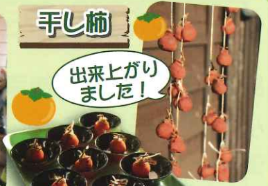
出来上がり ました！