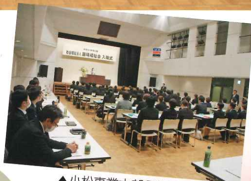
▲小松事業本部長挨拶