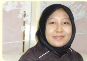
A・Nさん (インドネシア出身)