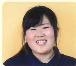
千葉工業高校 U・Aさん (アルバイト)