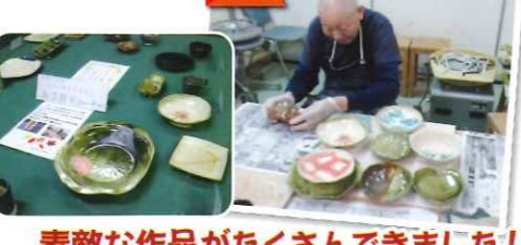
素敵な作品がたくさんできました!