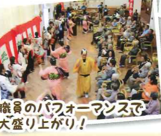
職員のパフォーマンスで大盛り上がり!