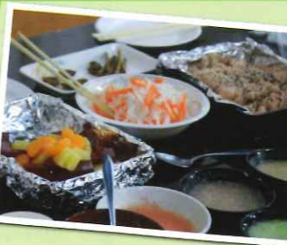
母ちゃん職員が腕をふるってご馳走作りました!