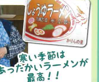
寒い季節はあったかいラーメンが最高!!