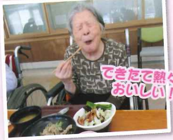
できたて熱々！おいしい！