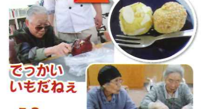
でっかいいもだねえ