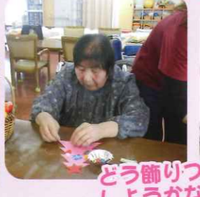
どう飾りつけしようかな♪