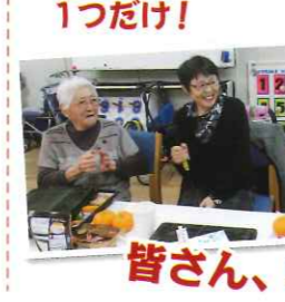
皆さん、5カ月間お疲れ様でした!