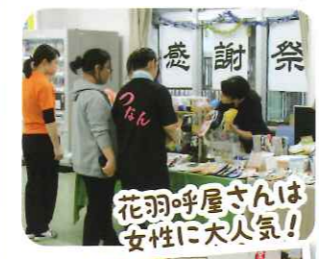
花羽呼屋さんは女性に大人気!