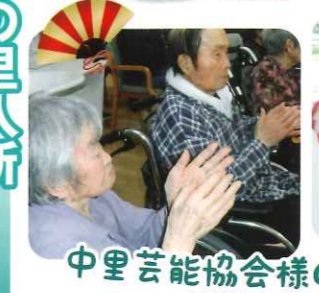
中里芸能協会様の踊りに魅了!!