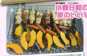
小春日和の中、炭のいい匂い