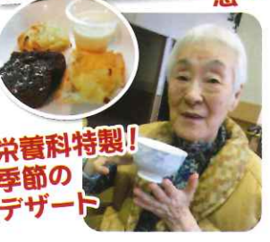
栄養科特製! 季節のデザート