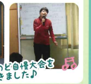
職員ものど自慢大会を開きました♪