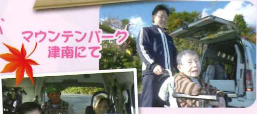
マウンテンパーク 津南にて