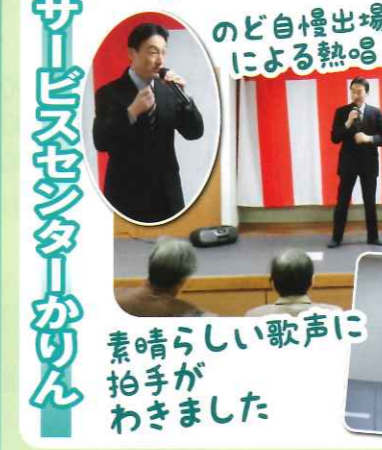
のど自慢出場者による熱唱!