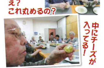
中にチーズが入ってる!