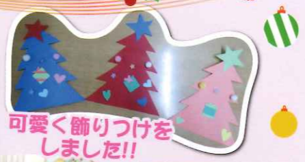
可愛く飾りつけをしました!!