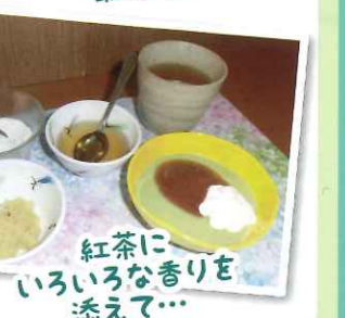
紅茶にいろいろな香りを添えて...