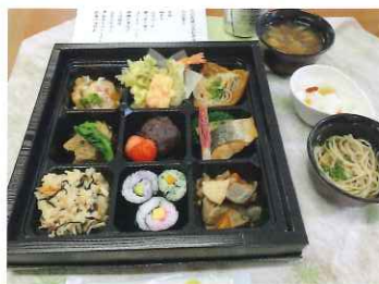
時節柄、祝賀会の開催は自粛し、栄養科が早朝から作ったお弁当をお持ち帰りいただきました。