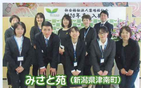
みさと苑 (新潟県津南町)