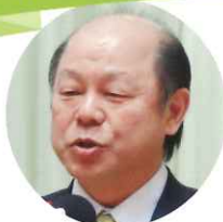
新潟県議会議員 尾身 孝昭 様