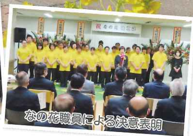
なの花職員による決意表明