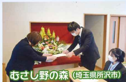
むさし野の森 (埼玉県所沢市)