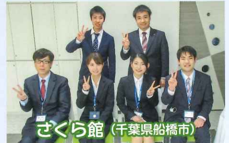
さくら館 (千葉県船橋市)