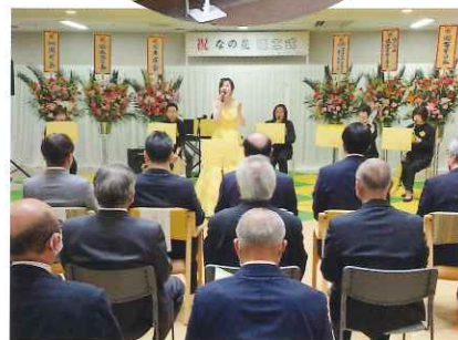
オープニングセレモニーでは職員を中心とした「Rape Blossoms Septet (なの花七重奏)」が演奏。