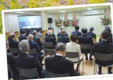
湖山理事長はWebでの参加となりましたが、まるですぐそこに居るかのようでした。