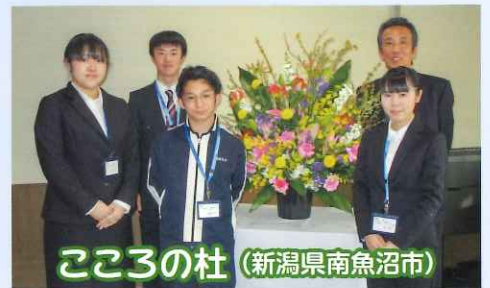
こころの杜 (新潟県南魚沼市)