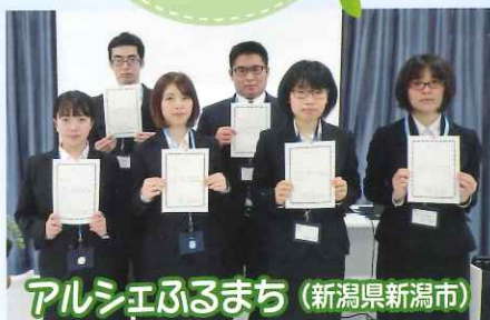
アルシェふるまち (新潟県新潟市)