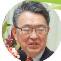
十日町市長 関口 芳史 様