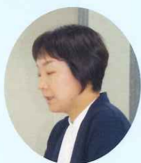
質疑に 応答する 浦井施設長(看護師)