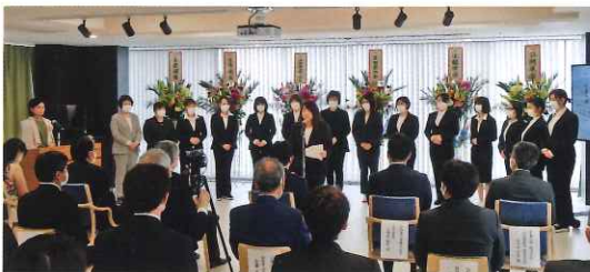
高野施設長と 代表職員による挨拶