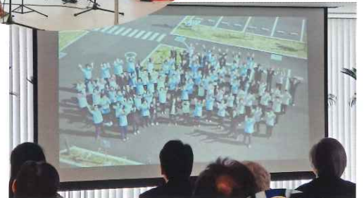
施設と職員をVTRで紹介