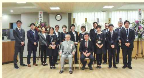
当日参加幹部 集合