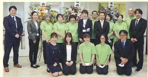
ヴィラわか葉 職員集合